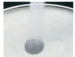
スポット微細シャワー

線の細いシャワーで、水ハネを大幅に低減。中抜けの無い、密度の高いシャワーなので、気持ちよく汚れを洗い流せます。用途に応じて整流にも切替えができます。