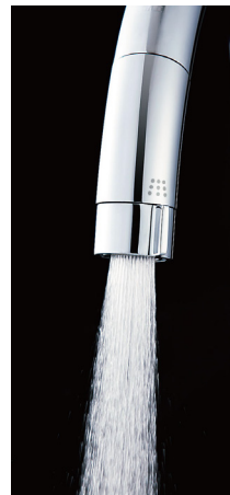
スポット微細シャワー